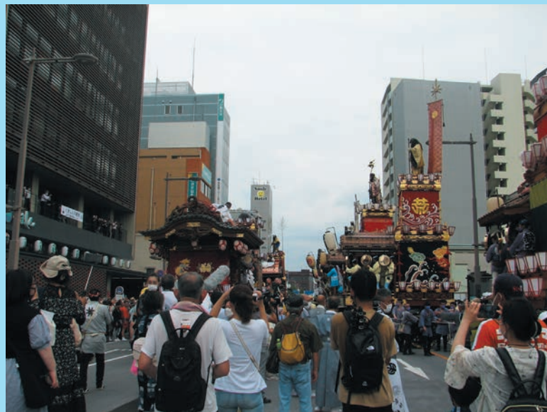
本店営業部・本部の前で山車と屋台の叩き合い