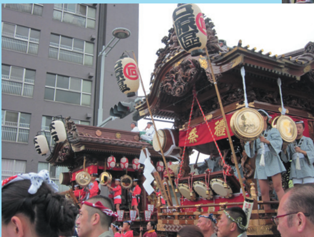
石原支店職員が曳いた屋台