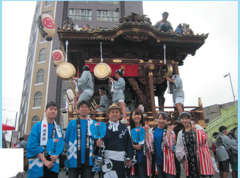
うちわ祭りに参加した石原支店職員