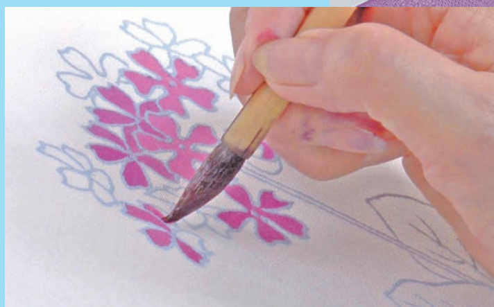
熊谷染め(熊谷市立熊谷図書館協力)